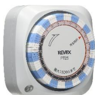
24h タイマーコンセント