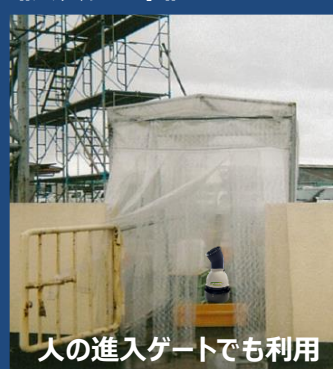
人の進入ゲートでも利用