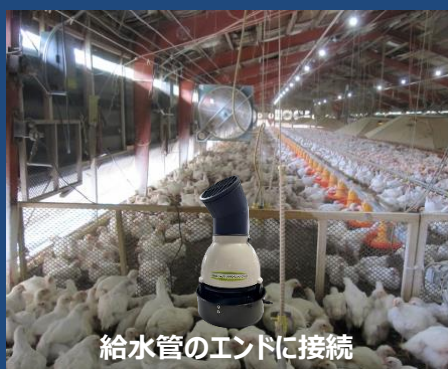
給水管のエンドに接続