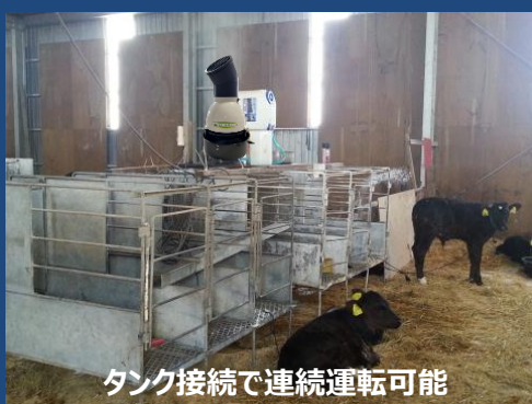
タンク接続で連続運転可能